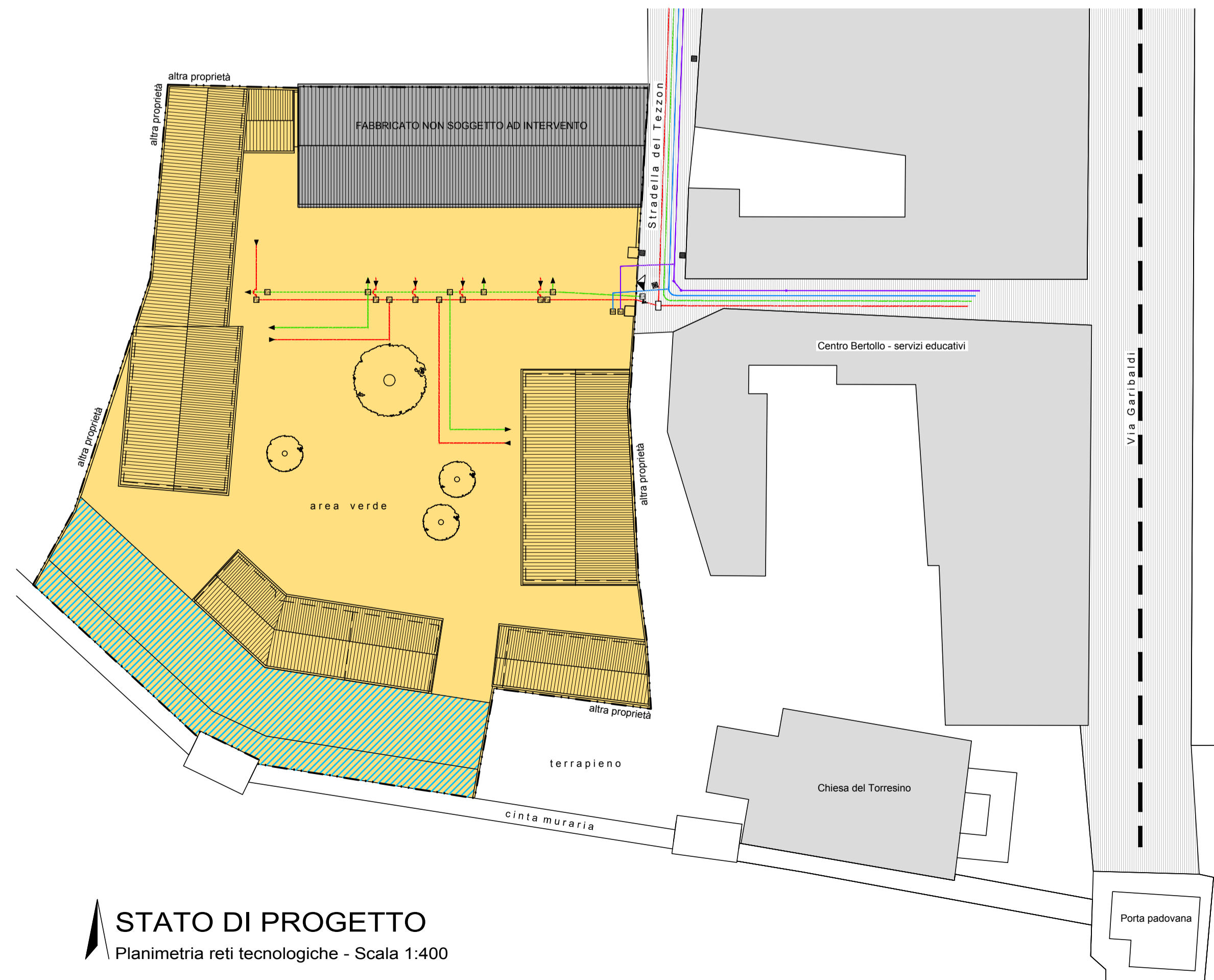
STATO DI PROGETTO Planimetria reti tecnologiche - Scala 1:400